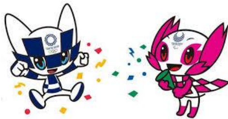
Mascotas Juegos Olímpicos 2020