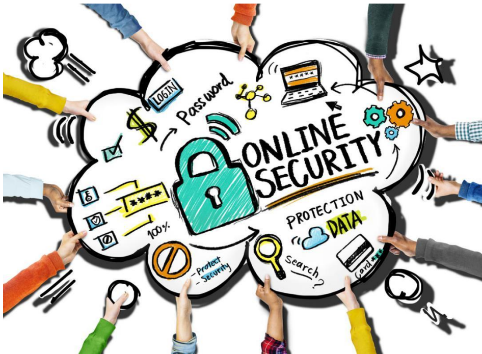
Imagen extraída de