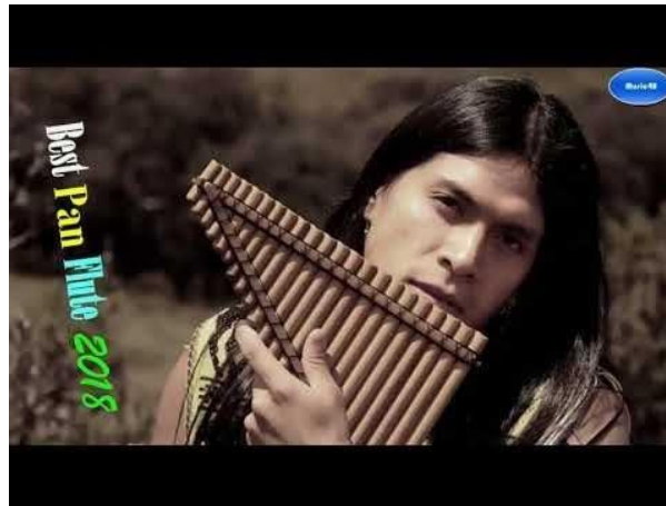
1 - Escucha como suena la flauta de pan

De allí nace ,según la leyenda, LA FLAUTA DE PAN.