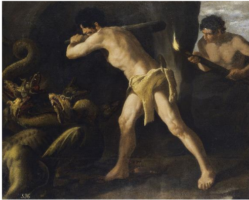
Hércules lucha con la Hidra de Lerna. 1634

El pintor español Francisco de Zurbarán , en también la pintó en a la Hidra en 1634 : Hércules lucha con la hidra de Lerna