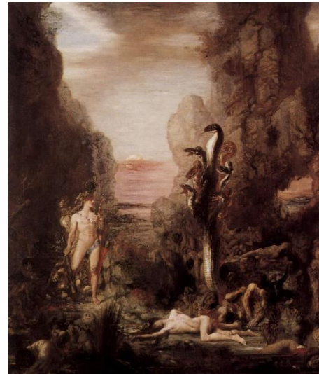
Hércules y la Hidra de Lerna. 1876

4. ¿En qué siglo pintó la Hidra Francisco de Zurbarán? ¿Y, en qué siglo la pintó Gustavo Mureau? ¿Cuántos siglos transcurrieron?