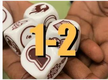
PRIMERO Y SEGUNDO