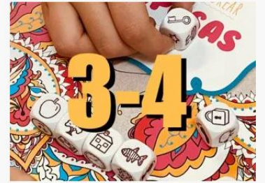
TERCERO Y CUARTO