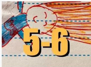
QUINTO Y SEXTO